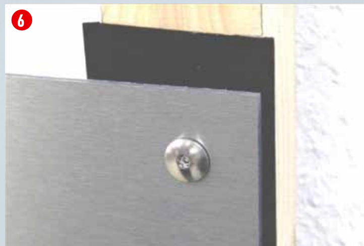
Fertig erstellter Festpunkt/Gleitpunkt