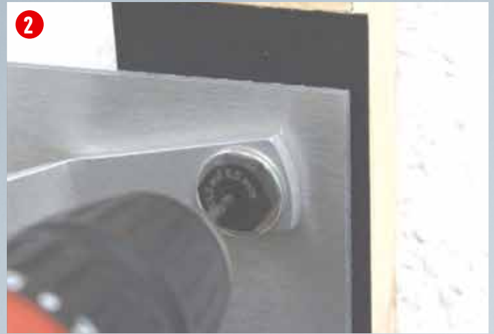
Einsatz Bügelbohrvorrichtung, Vorbohren der Holz-UK