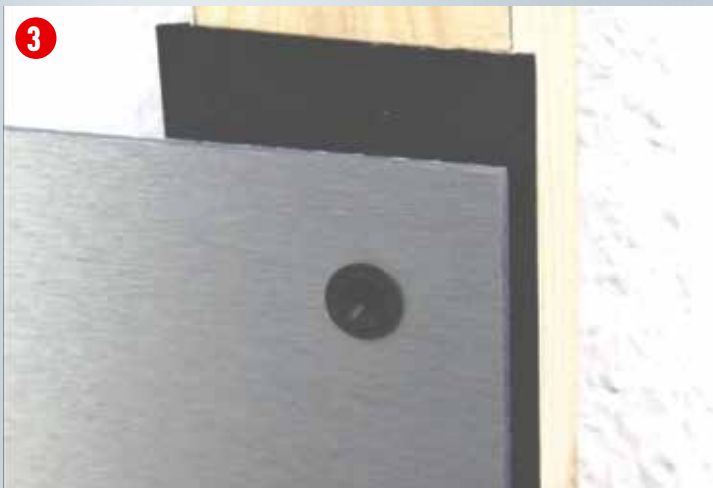
Gleitpunkt: Dichtring in Plattenbohrung