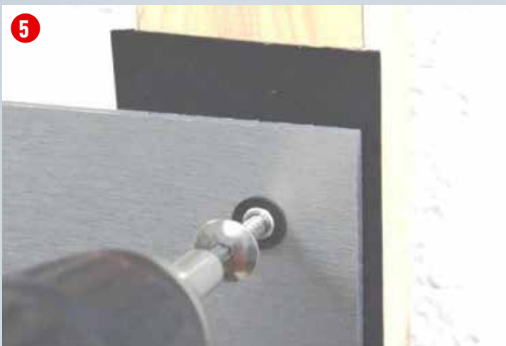
Festpunkt: zuerst Dichtring in Platte, danach Festpunkthülse eindrücken